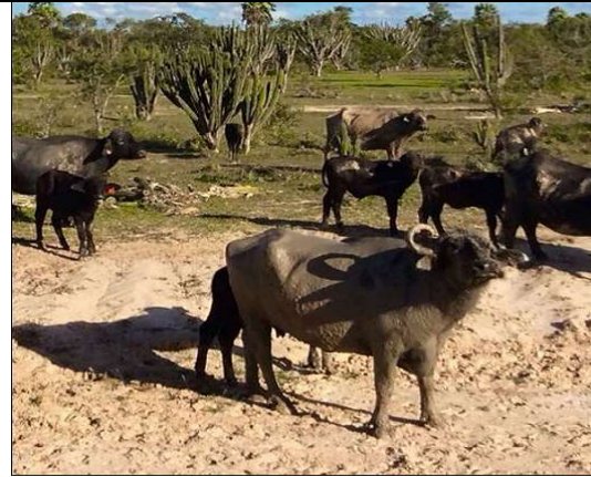
Buflalos en semi desiertos de Bolivia