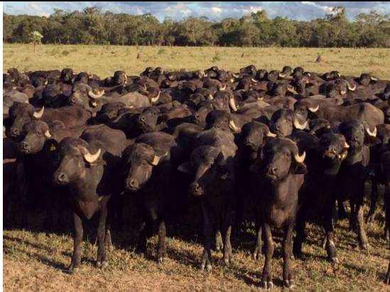
Buflaos en saavanas bolivianas