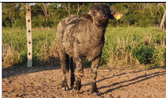
Bufalita de 6 meses de edad con 223kg peso vivo