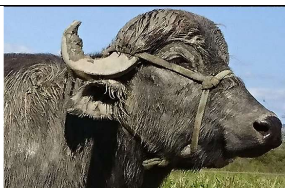
El primero reproductor de la bufalera PA EMEPZAR, por su mansedumbre, docilidad y agradecimiento al mismo animal decidimos que sera nuestro adorno por lo que tenga vida.