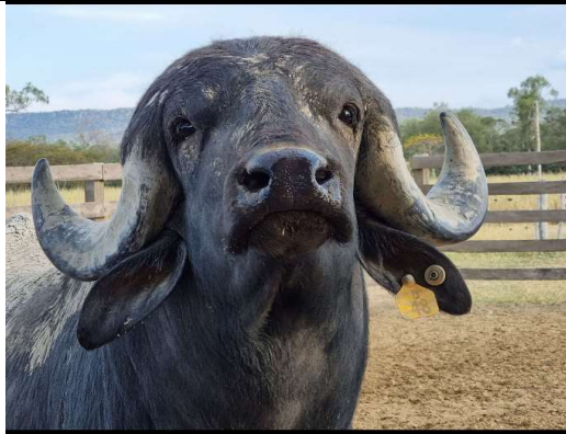
Su mirada lo dice todo, es amor a primera vista.