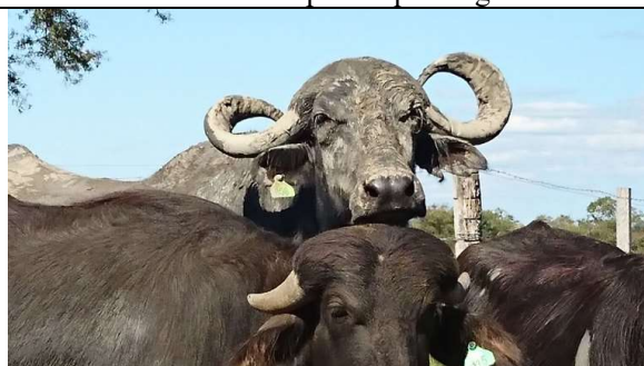
Sra. Matilde siempre atenta a su entorno